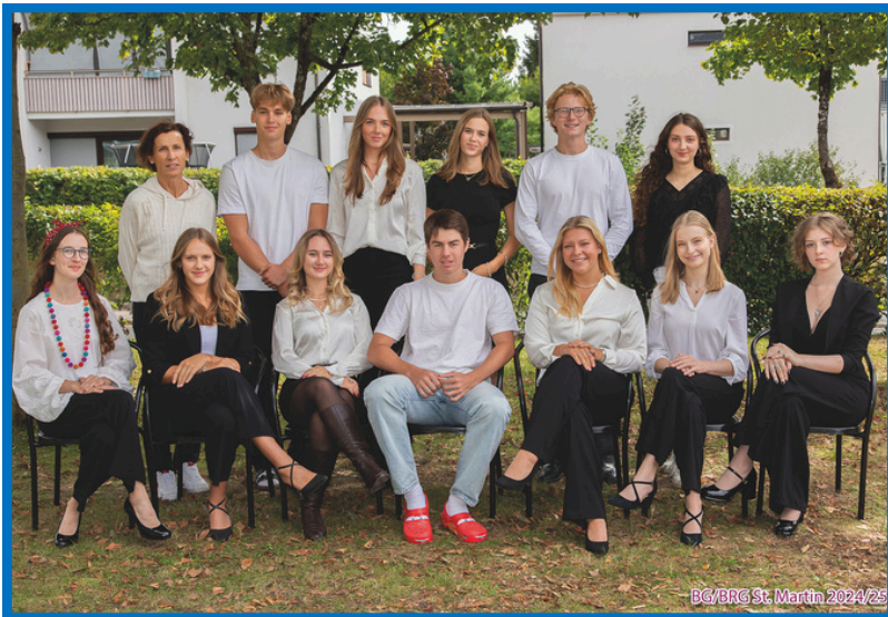
Klasse 8a Matura 2025

Der Bili-Zweig ist jedoch weit mehr als nur Unterricht auf Englisch. Man lernt Menschen aus der ganzen Welt kennen. Während meiner Schulzeit durfte ich zahlreiche Native Speaker kennenlernen, mit unterschiedlichster Herkunft, sei es aus Neuseeland, England, Wales, den USA oder Indien, die auch Einblicke in andere Kulturen geben konnten.