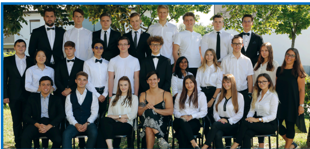
Klasse 8CB|R Matura 2020