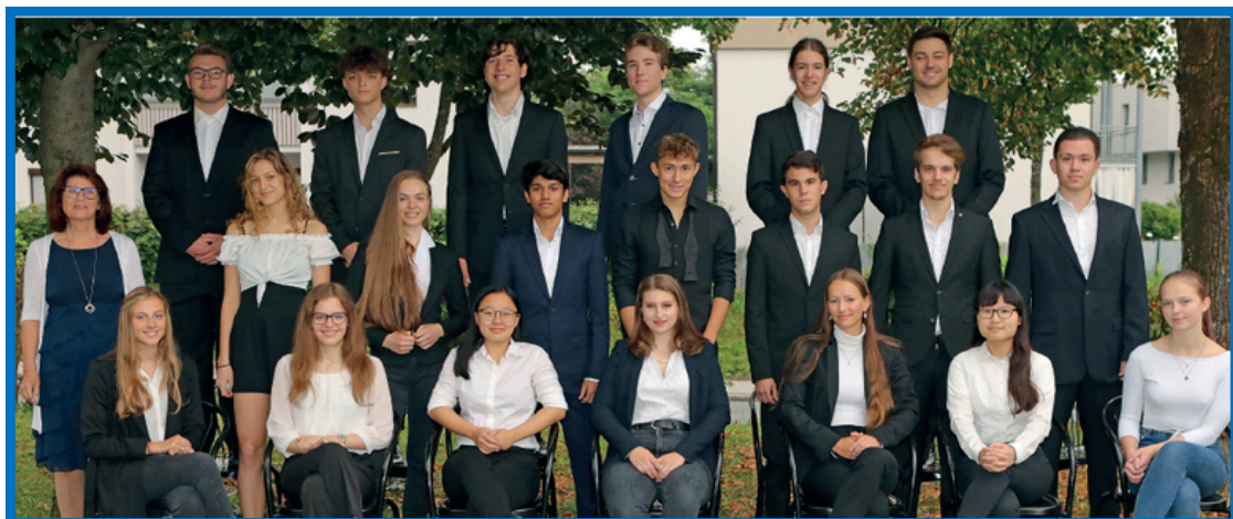
Klasse 8b Matura 2021