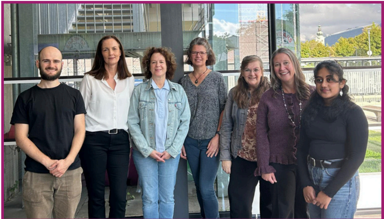
Native Speaker Team