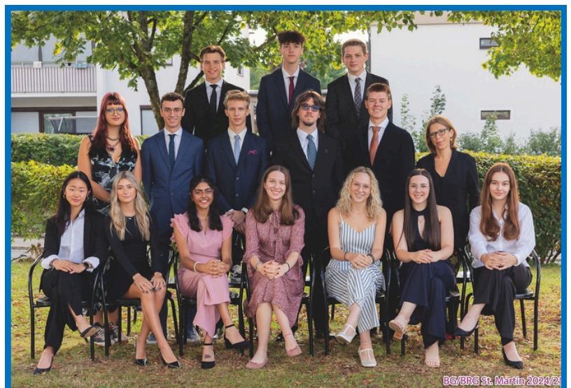
Klasse 8b Matura 2025