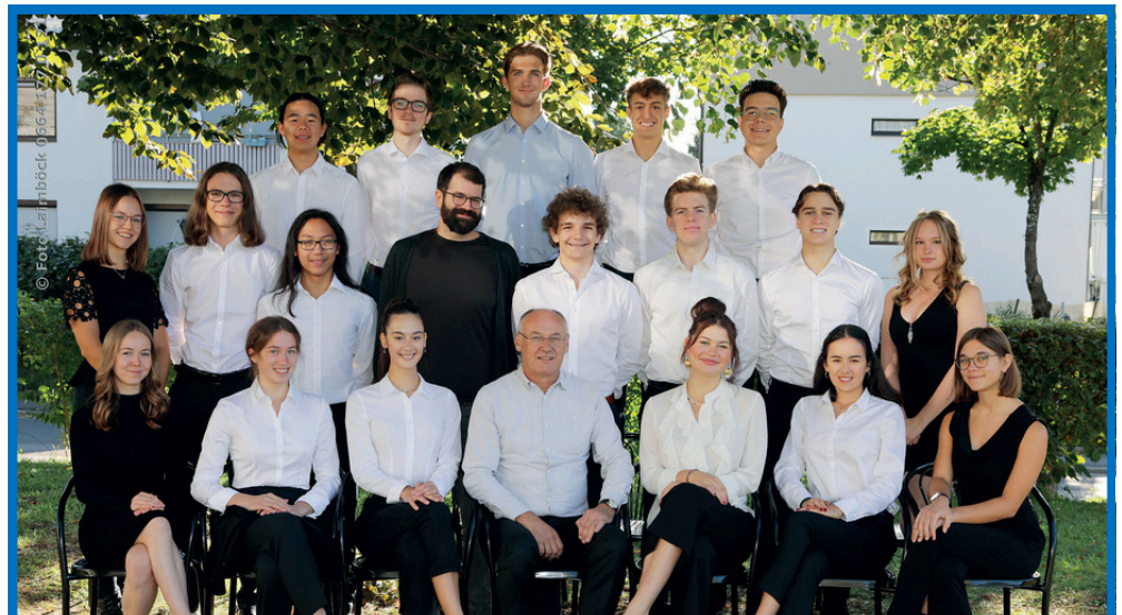
Klasse 8b Matura 2023