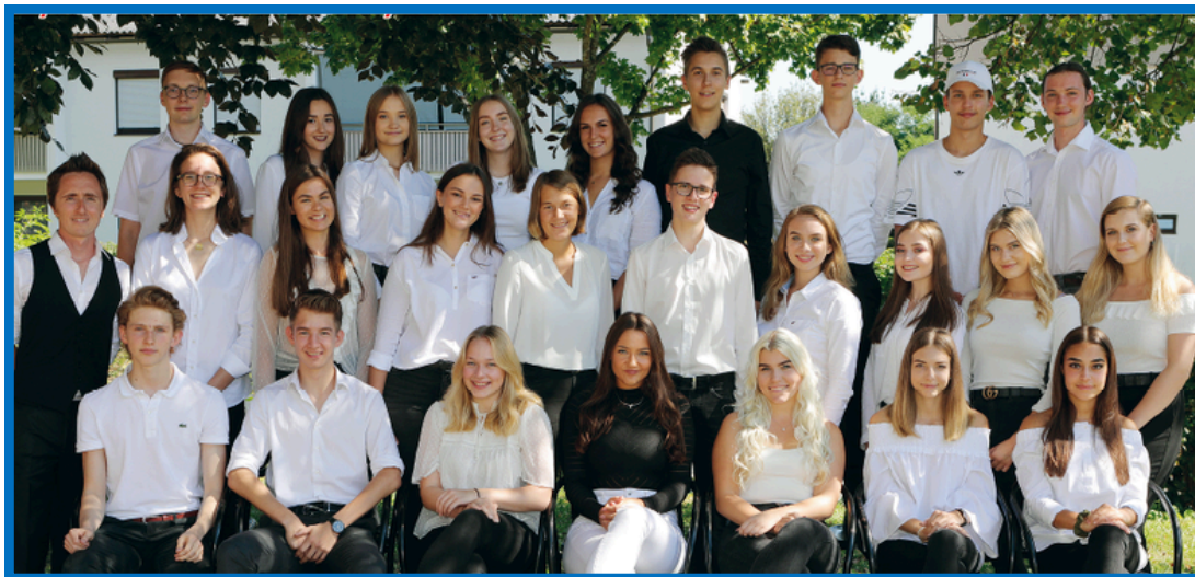
Klasse 8a Matura 2020