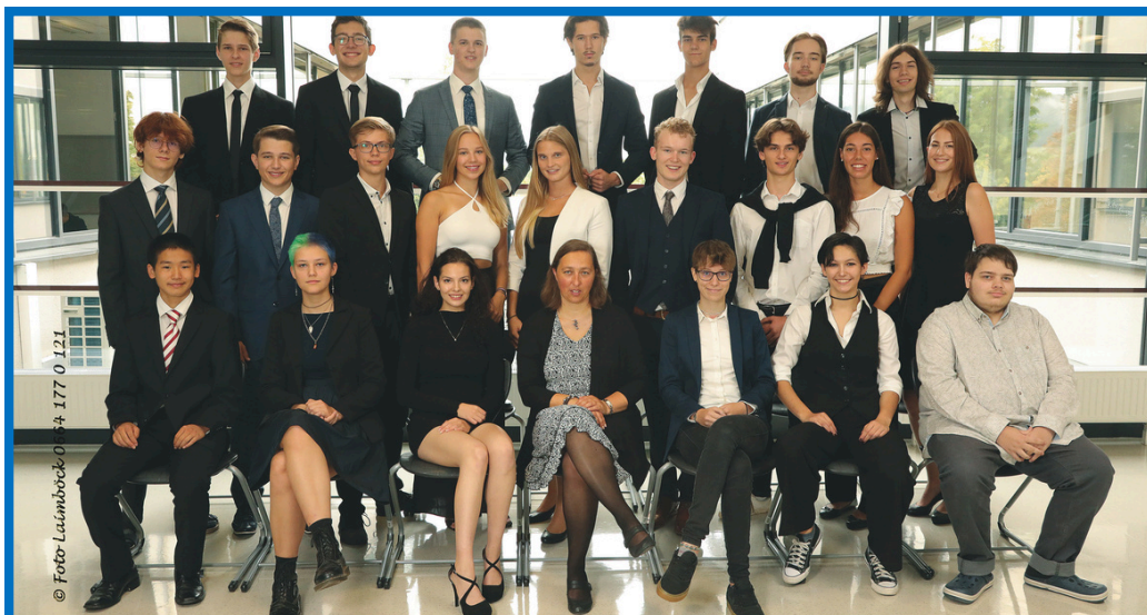
Klasse 8a Matura 2022

My message to current students would be to make the most of your time at St Martin's: don't be shy, be creative and use every opportunity you get to practise presenting. You never know when you might need it.