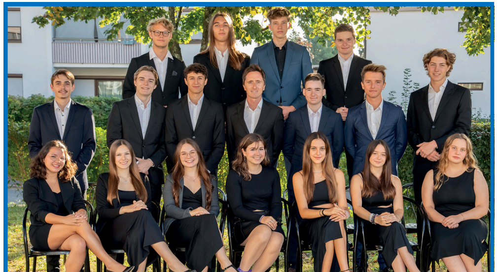
Klasse 8b Matura 2024